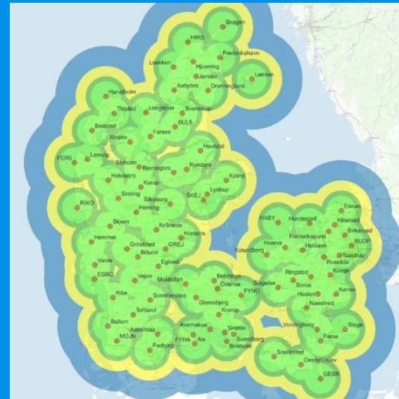
• From RTKconnect.dk